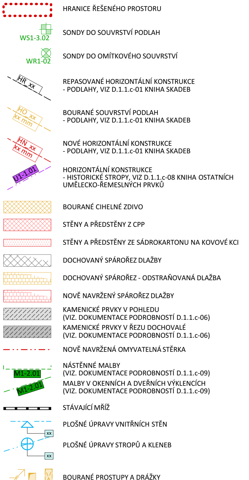
01-1-01 OKNA (VIZ. DOKUMENTACE PODROBNOSTI D.1.1.c-02) 01-2-02 DVĚŘE (VIZ. DOKUMENTACE PODROBNOSTI D.1.1.c-03) 01-3-01 KLEMPÍŘSKÉ PRVKY (VIZ. DOKUMENTACE PODROBNOSTI D.1.1.c-04) 01-3-02 ZAMĚČNÍČE A KOVÁŘSKÉ PRVKY (VIZ. DOKUMENTACE PODROBNOSTI D.1.1.c-05) 01-3-03 KAMENICÍ PRVKY (VIZ. DOKUMENTACE PODROBNOSTI D.1.1.c-06) 01-3-04 TRUHÁŘSKÉ A TESAŘSKÉ PRVKY (VIZ. DOKUMENTACE PODROBNOSTI D.1.1.c-07) 01-3-05 OSTATNÍ UMĚLEČKO-ŘEŠENÍ PRVKY (VIZ. DOKUMENTACE PODROBNOSTI D.1.1.c-08)